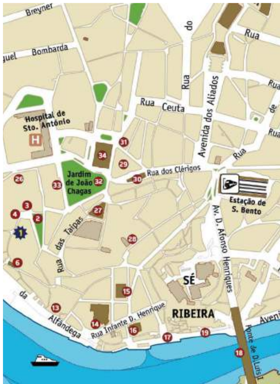
Itinerário 3: 2, 26, 3, 27, 28, 29, 30, 31, 32, 33 e 34